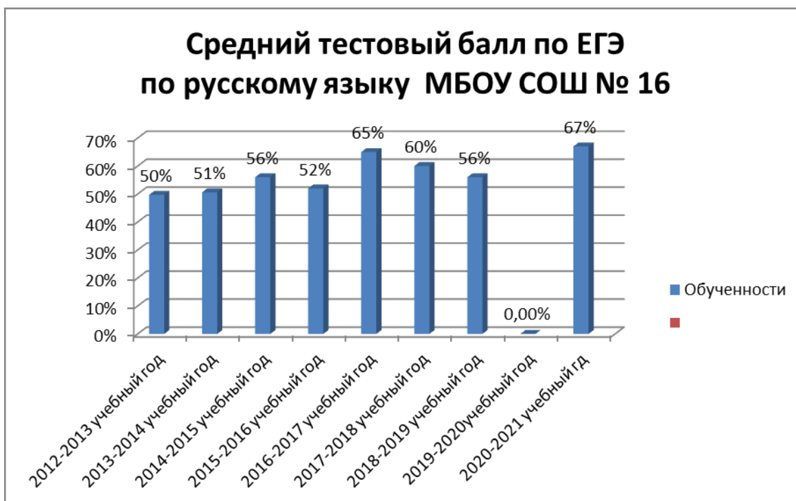
Таблица 1. Анализ результатов государственной (итоговой) аттестации выпускников 11 класса